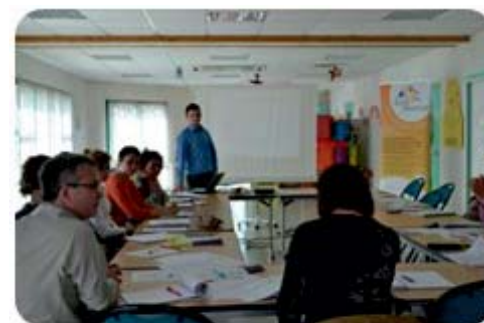
L'alliance « Attractivity of Coëvrons »