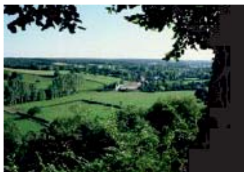
Photos de la mare de La Fenderie au village de Deux-Evailles.